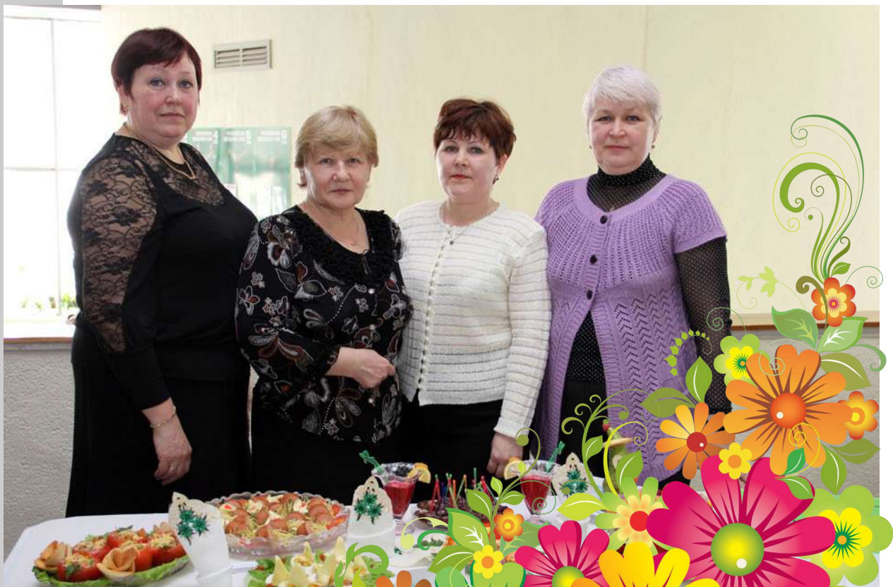
Фото ФАКТ С праздником, Милые дамы!