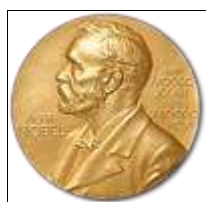
Нобелевская премия по литературе-2013.

Критика постоянно сравнивает Манро с Чеховым, и это сравнение не лишено оснований: подобно русскому писателю, она умеет рассказать историю так, что читатели, даже принадлежащие к совсем другой культуре, узнают в героях самих себя. Сдержанность, демократизм, правдивость, понимание тончайших оттенков женской психологии, способность вызывать душевные потрясения – вот главные приметы стиля великой писательницы.