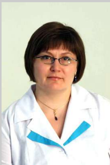
Заместитель директора по организации травматолого -ортопедической помощи населению