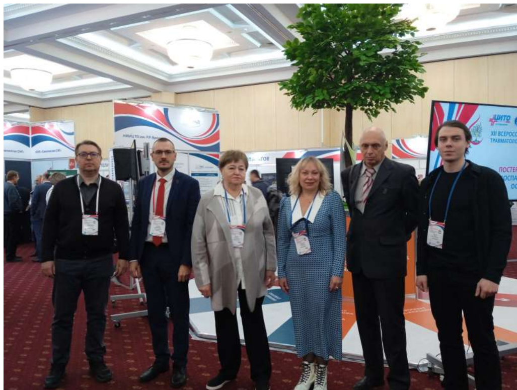
Делегация врачей Центра Илизарова на открытии Съезда травматологов-ортопедов 1 декабря 2022 года