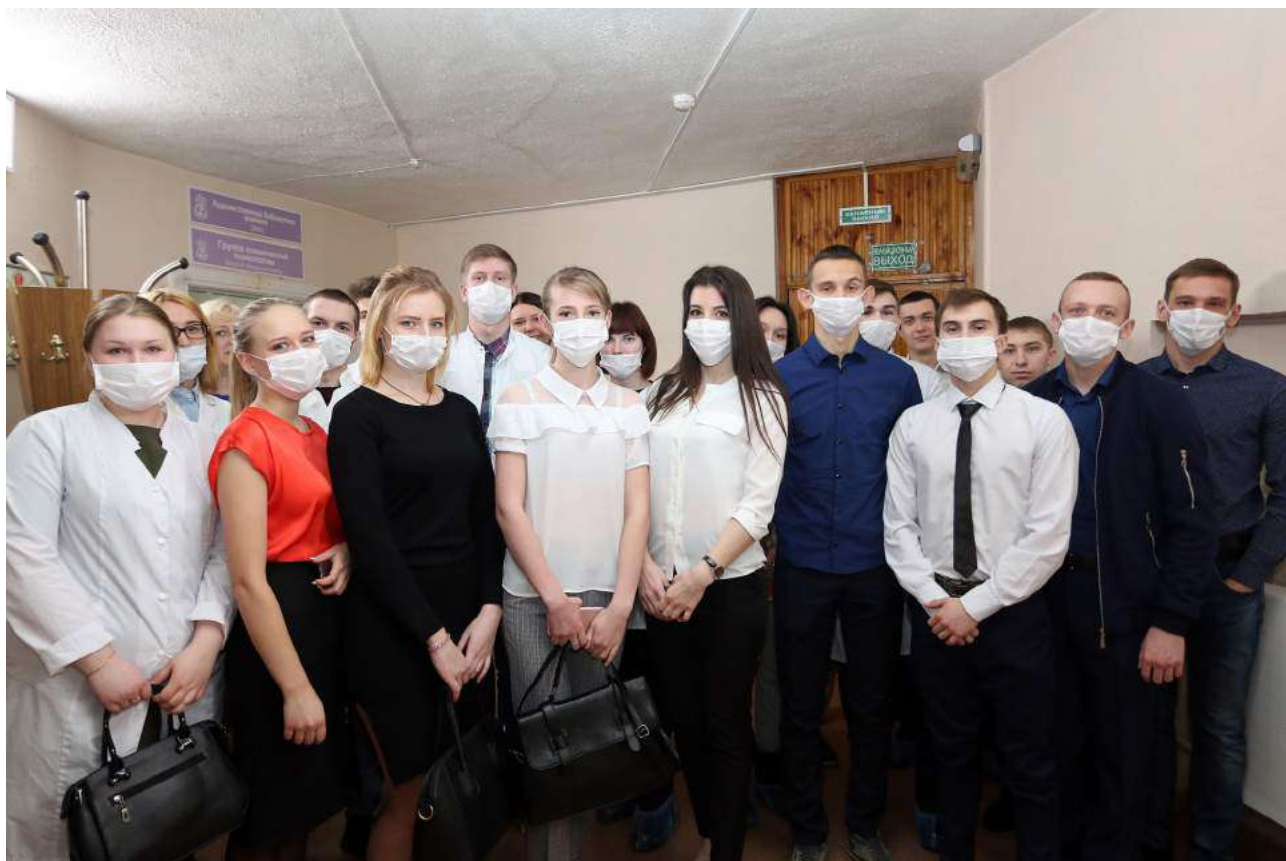
Масочный режим в Центре Илизарова