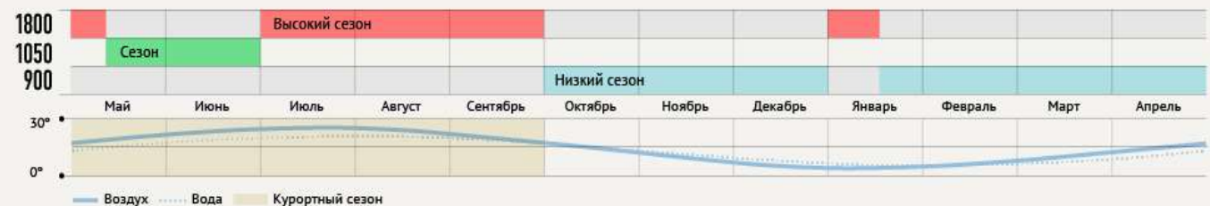
Цена за сутки 2-местного номера в трёхзвёздочном отеле в Ялте, руб.

Источники: rzd.ru, crimea.gov.ua, kavkaz-uzel.ru, crimea.vgorode.ua, hotels24.ua, booking.com, airbnb.ru, dobrotel.com, morvesti.ru